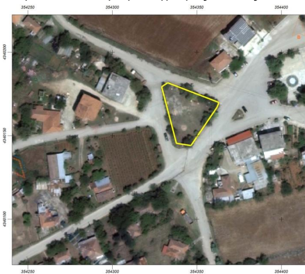
1. Παιδική χαρά Βαρδαλής

Παρακάτω οι αεροφωτογραφίες από τις παιδικές χαρές: