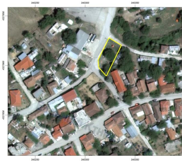
3. Παιδική χαρά Μακρυρράχης