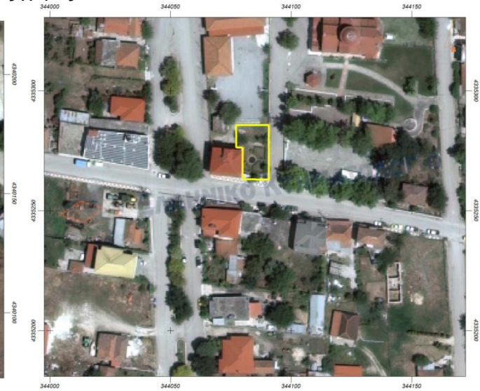
2. Παιδική χαρά Εκκάρας