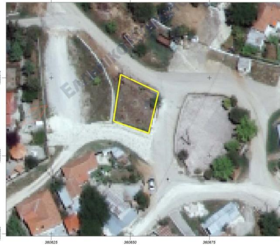
7. Παιδική χαρά Φυλιαδώνας