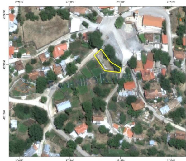
4. Παιδική χαρά Νεοχωρίου