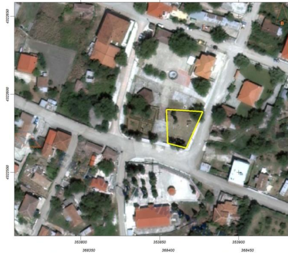
5. Παιδική χαρά Ξυνιάδας